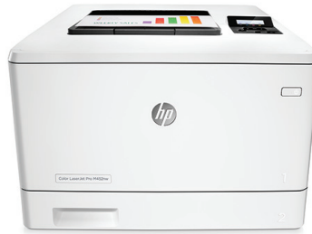
HP LaserJet Pro M452dn

Un rendimiento ideal de impresión y seguridad sólida para su forma de trabajar. Esta impresora en color compatible acaba los trabajos más rápido y ofrece amplia seguridad para la protección contra las amenazas. 1 Los cartuchos de tóner original HP con JetIntelligence producen más páginas. 2