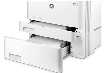
HP LaserJet Pro M452dn con bandeja de 550 hojas opcional